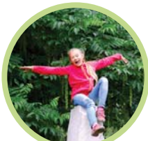
DEN RAUM EROBERN

• Als Planer ist es auch besonders wichtig, dass man mit allen Sinnen (Sehen, Hören, Riechen und Schmecken) und vor allem mit offenen Augen einen unbekannten Ort erforscht. Der Park, die Spielplätze an der Kirche und der Schule wurden genauso unter die Lupe genommen. Die große Frage im Hinterkopf der Entdecker war stets: