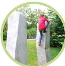
DEN RAUM ERFORSCHEN