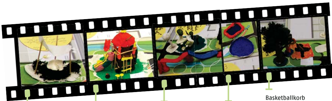
Sitzgelegenheit mit Sonnensegel

3 DAS ENTWERFEN Nachdem V.A.E die Umgebung bis ins Detail untersucht und entdeckt hat, modellierte sie mit Fimo und andere Bastelmaterialien die gewünschten Dinge, die im neuen Park auf keinen Fall fehlen dürfen (Spielgeräte, Bänke, etc.). Da jeder einzelne Planer eigene Ideen und Vorstellungen hatte, gab es ganz unterschiedliche Modelle und Wünsche. Die Standorte der einzelnen Modelle im Park wurden von der Gruppe bestimmt, wodurch ein großes Modell entstand. Um euch ein besseres Bild über die einzelnen Ideen zu machen, schaut euch den Bildstreifen an: