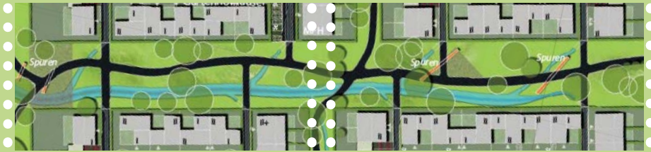
Der Park im Überblick

5 DIE WEITEREN PLANUNGEN Dank der professionellen Arbeit von der Planungsgruppe V.A.E aus JerryTown konnte das Erwachsenen-Planungsbüro einen Park planen, dem es an Gemütlichkeit, Sauberkeit und Spielmöglichkeiten in keinsten Weise fehlt. Es ist ein Park-Plan entstanden, in dem vor allem die Kinder der neu zuziehenden Familien den ganzen Tag spielen können. Es ließen sich leider nicht alle Ideen, die die Planungsgruppe V.A.E. erarbeitet hat, umsetzen, aber vor allem das gewünschte Spielen mit Wasser oder die vielen Sitzgelegenheiten finden einen Platz in dem neuen Park. Auch der Picknickbereich und die Klettergelegenheiten machen den Park zu etwas Besonderem. In den beiden Plänen könnt ihr erkennen, wo die Architekten und Landschaftsplaner welche Spielgeräte vorgesehen haben. Sobald alle notwendigen Planungsschritte erfolgt sind, wird der Park gebaut.